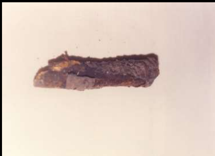
پوسیدگی سیاه ریشه