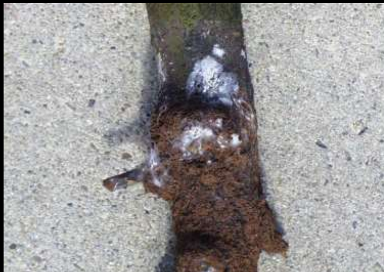
پوسیدگی سفید ریشه