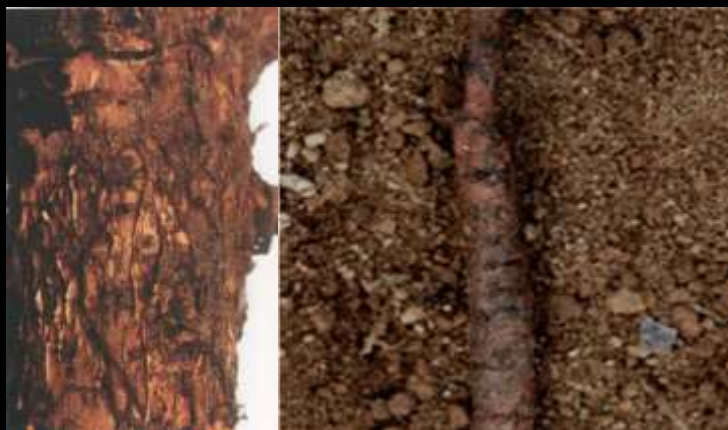
پوسیدگی بنفش ریشه